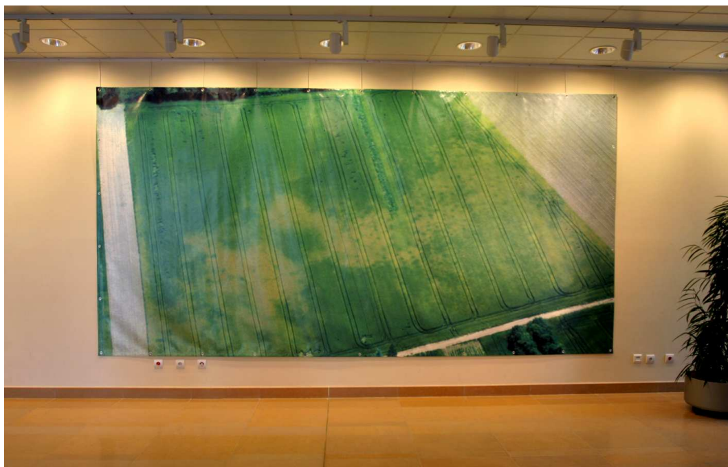
5- Bâche de décor montrant un site néolithique découvert à Flins-sur-Seine : emprunt optionnel (2,5 x 5 m).