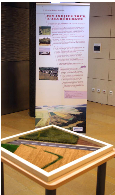
2- Ensemble « totem et maquette ».