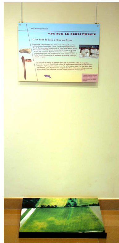
3- Ensemble présentant un site.