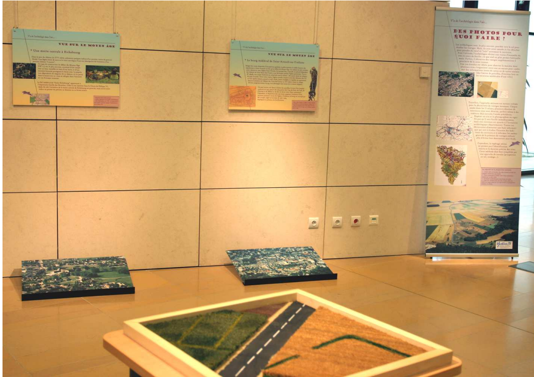
1- Vue de l'exposition, présentée à Montigny avec deux sites, un totem et la maquette.