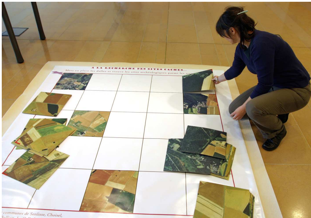
4- Jeu au sol : assemblage des dalles restituant une vue aérienne avec sept faux sites.