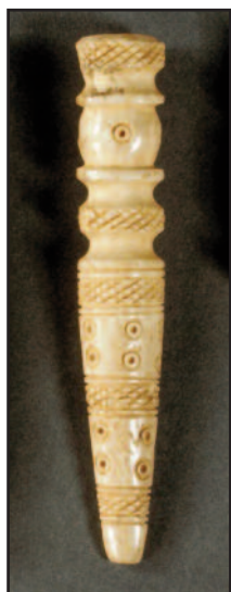
Dimensions : 7,3 x 1,3 cm.