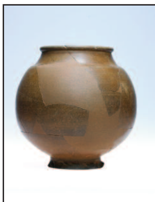
Dimensions : 13 cm de h. et 12 cm de diamètre max.