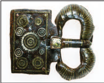
Dimensions : 6,5 x 5 cm.