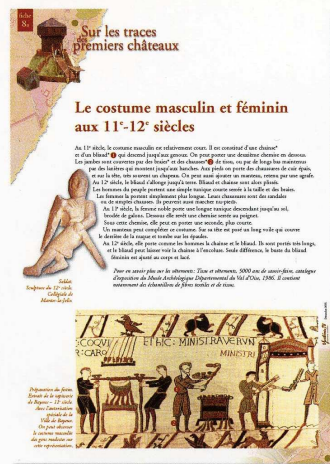
Exemple de fiche pédagogique accompagnant la maquette.

Directeur de la publication : Franck Borotra Codirecteur de la publication : Philippe Legrix Ont participé à ce numéro : G. Cavalli, B. Dufay, M.-A. Charier, P. Laforest. Service archéologique départemental des Yvelines ISSN : 1261-8608 Dépôt Légal : Septembre 2002 - Périodicité : irrégulière Imprimerie : Wauquier - Tél. : 01.30.93.02.17 Imprimé en France - Septembre 2002