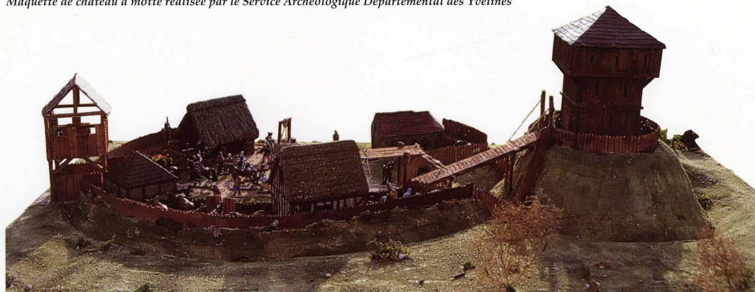
Maquette de château à motte réalisée par le Service Archéologique Départemental des Yvelines