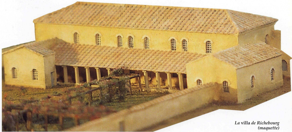
La villa de Richebourg (maquette)