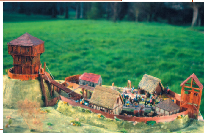
Un château à motte aux XI e -XII e siècles (maquette au 1/70 e ).