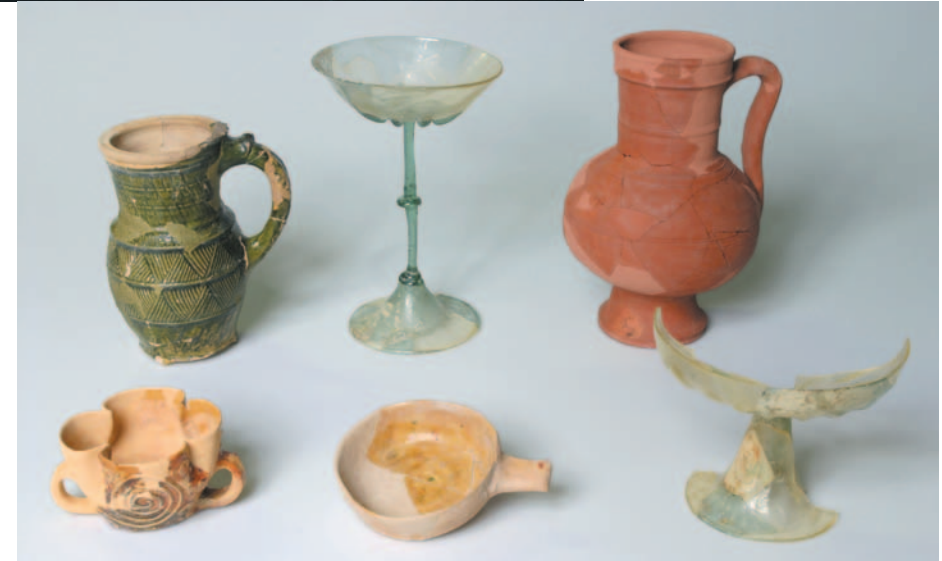
Vaisselle de table du XIII e au XV e siècle, découverte à Poissy et au château de la Madeleine à Chevreuse.