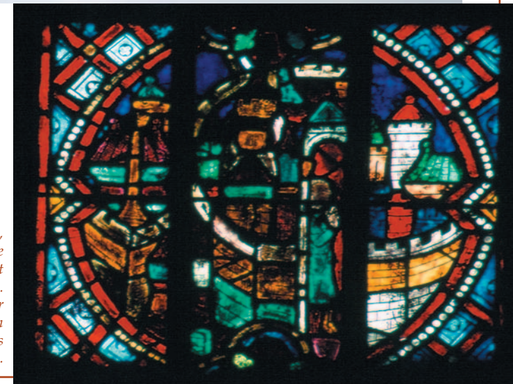
Vitrail du XIII e siècle, église Sainte-Anne de Gassicourt à Mantes-la-Jolie. La ville, symbolisée par sa muraille, marque son identité vis-à-vis de la campagne environnante.