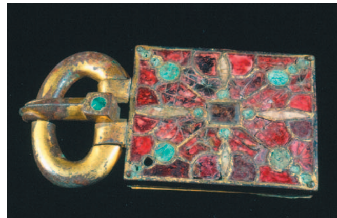
Boucle de ceinture de type wisigothique (alliage cuivreux doré, malachite et verroteries blanches et rouges) du VI e siècle, découverte lors de la fouille de la nécropole mérovingienne de Vicq.